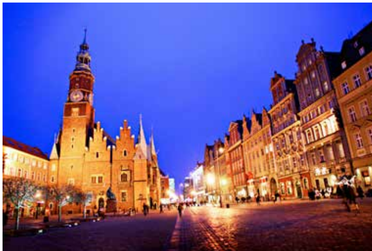
Torget i gamlebyen i Wrocław ble gjenreist etter krigen. Et naturlig og livlig sentrum i byen.

Reiselysten? Sjekk våre guider og tips på ap.no/reise