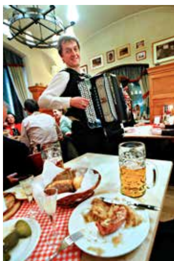
Livlig polsk middag på restauranten Podwale 25 i Warszawa. Et sted for enorme porsjoner polsk husmannskost og trekkspill-musikk ved bordene.

– Nordmenn har generelt godt økonomi. Vi reiser dit vi vil, men vi burde kanskje tatt mer høyde for valutasingninger, da kan du få mer for pengene, sier hun.