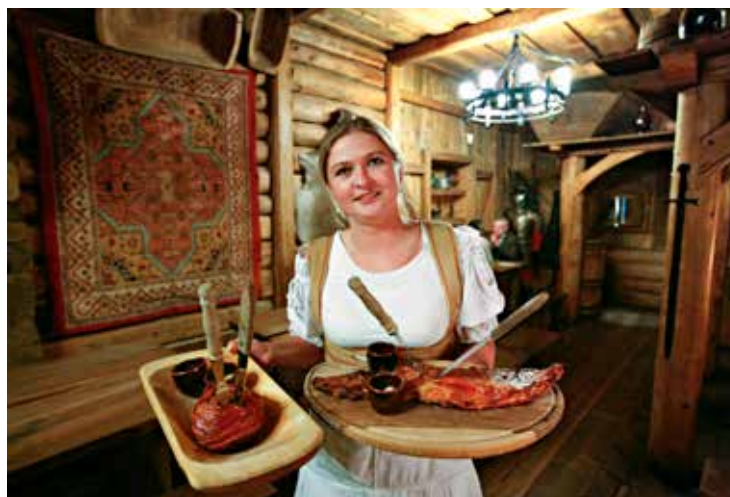
Vennlighet, lave priser og god mat er tre ting mange forbinder med Polen. Tradisjonell polsk mat er kraftkost, her fra en restaurant i Krakow.