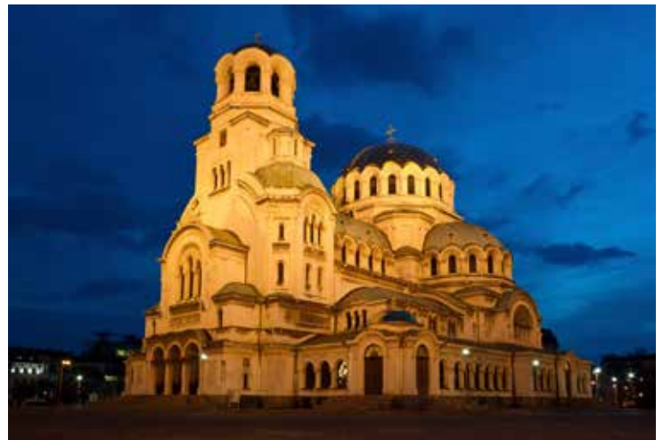
Sofia i Bulgaria er nummer én på listen over de rimeligste storbyene i høst. Dette er Aleksander Nevsky-katedralen i byen.