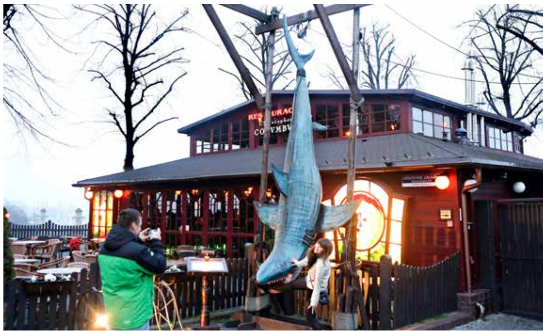
På denne restauranten i Szczecin, Polen, er det utvilsomt fisk på menyen og moro for turister.