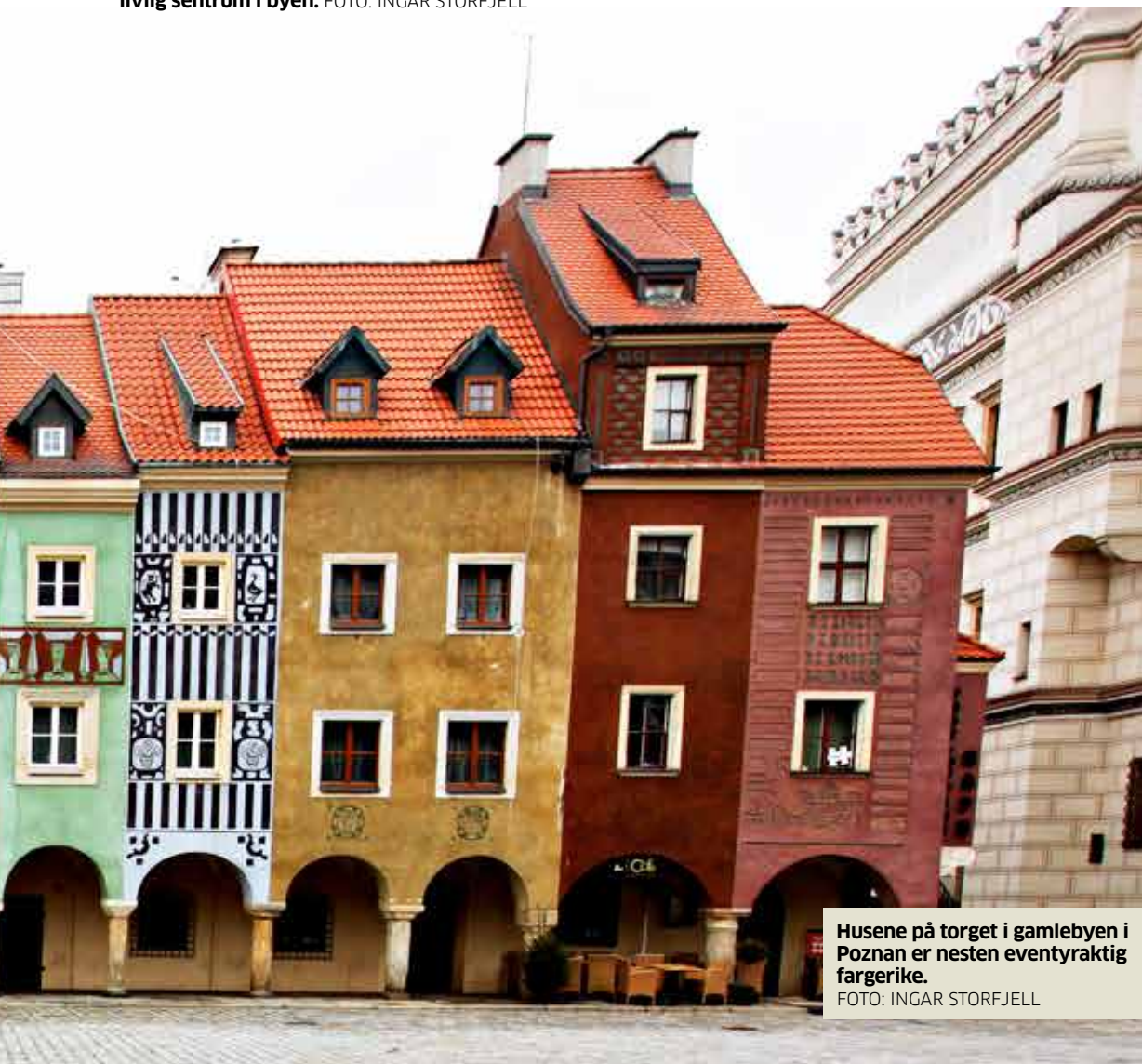
Husene på torget i gamlebyen i Poznań er nesten eventyrlig fargerike.